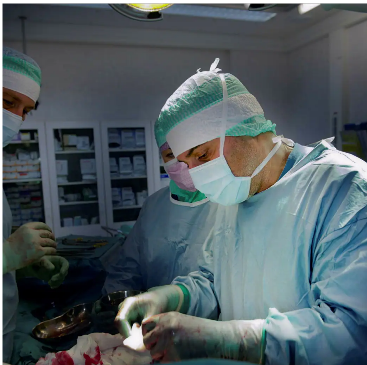
Kirurgen Paolo Macchiarini under en operation. Från dokumentären "Bad Surgeon."